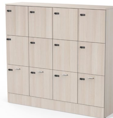
Tapa, base, laterales, centros, lejas fijas intermedias, trasera y frontales