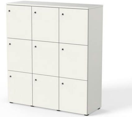
Tapa, base, laterales, centros, lejas fijas intermedias, traseña y frontales