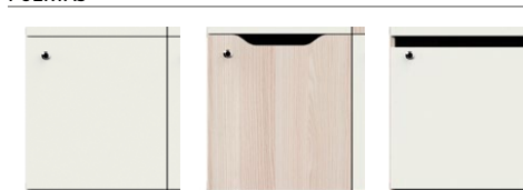
Puerta batiente con bisagras | Puerta batiente con escote/buzón y con bisagras | Puerta batiente con buzón y con bisagras