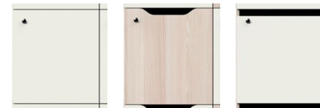
Puerta batiente con bisagras Puerta batiente con escote/buzón y con bisagras Puerta batiente con buzón y con bisagras