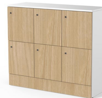
Tapa, base, laterales, centros, lejas fijas intermedias y trasera