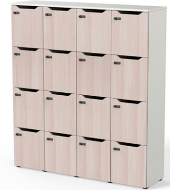
Tapa, base, laterales, centros, lejas fijas intermedias y traseña