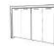
4 doors medium composition Composición mediana 4 puertas Composition moyenne 4 portes Композиция средних шкафов с 4-мя дверьми