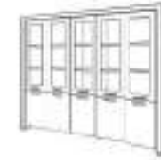
5 doors high composition Composición alta 5 puertas Composition haute 5 portes Высокая композиция с 5 дверцами.