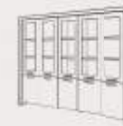
5 doors high composition Composición alta 5 puertas Composition haute 5 portes Высокая композиция с 5 дверцами.