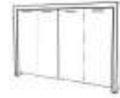
4 doors medium composition Composición mediana 4 puertas Composition moyenne 4 portes Композиция средних шкафов с 4-мя дверьми