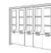
5 doors high composition Composición alta 5 puertas Composition haute 5 portes Высокая композиция с 5 дверцами.